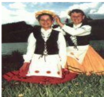
Strój Zespołu "Gochy"

W zespole tańczyły i śpiewały również dzieci ze szkoły podstawowej. Obecnie zespół liczy 50 osób (dorośli, młodzież i dzieci). Stroje początkowo były wykonywane we własnym zakresie oraz przy skromnej pomocy miejscowego SKR-u i GS-u. Kolorystyka strojów harmonizuje z otaczającą przyrodą. Dominuje w nich zieleń, ponieważ w pobliżu Lipnicy znajduje się mnóstwo lasów, łąk i jezior.